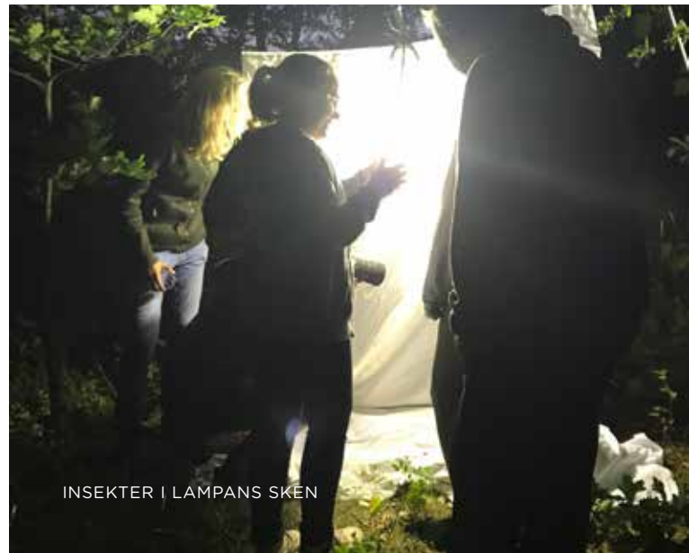
INSEKTER I LAMPANS SKEN