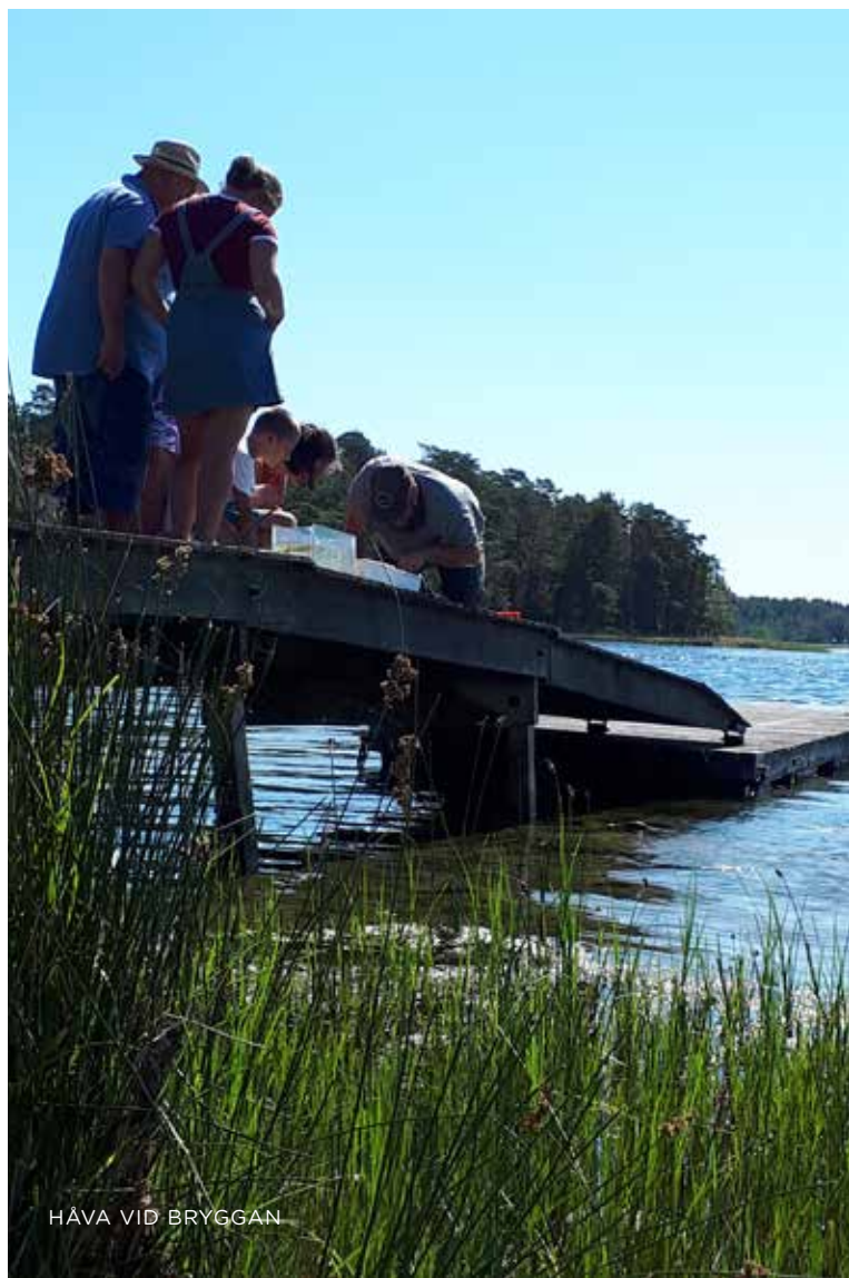
HÅVA VID BRYGGAN

Sommaren är kommen och med den ledighet, sol och bad. Hos oss på naturum Trollskogen kan du lära dig mer om naturen i Trollskogen, få guidade turer eller uppleva naturen på egen hand.